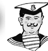
Rakousko - Uhersko